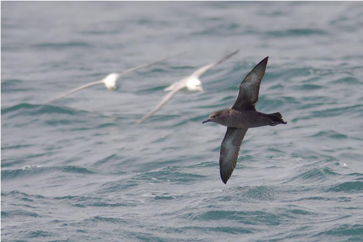
Grauwe Pijlstormvogel (Peter Soer)