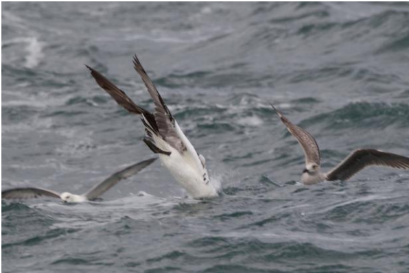
Jan-van-Gent (Luc Hoogenstein)