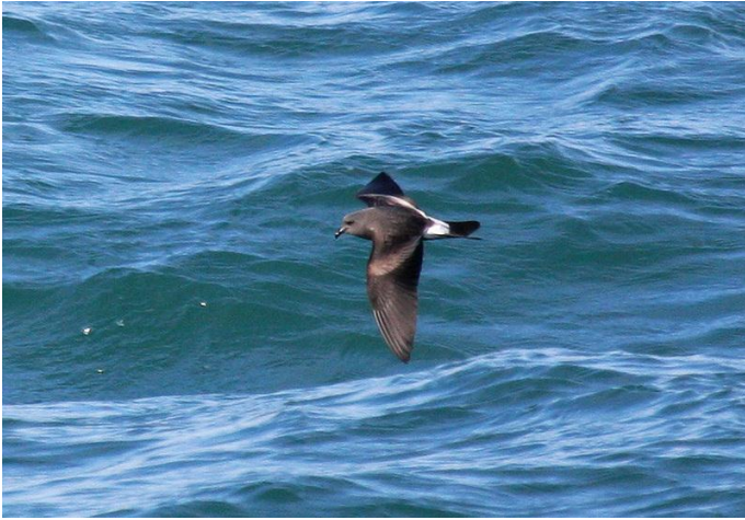
Vaal Stormvogeltje (Bart Vastenhouw)