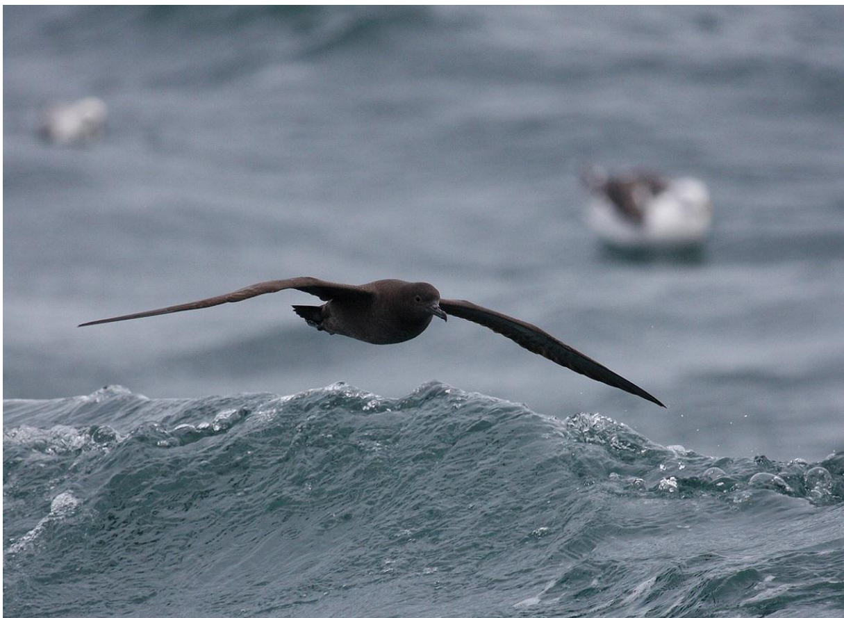
Grauwe pijlstormvogel (Bart Vastenhouw)

Dit is de meest uitgebreide en spectaculaire zeetocht die je in Nederlandse wateren kunt maken. Omdat we twee nachten en één volle dag op zee gaan varen, kunnen we veel verder van de kust komen. Dit maakt dat we twee interessante zeevogelrijke gebieden kunnen bezoeken: de Klaverbank en de Botney Cut. Op deze tocht kun je in Nederland ervaren hoe vogels leven op volle zee; een unieke mogelijkheid. Speur met ons mee over de golven, geniet van het eindeloze weidse uitzicht en ervaar de adrenaline kick als er plotsklaps een zeldzame soort pal achter de boot opduikt! (Alle foto's hieronder zijn tijdens eerdere edities van deze tocht gemaakt!)