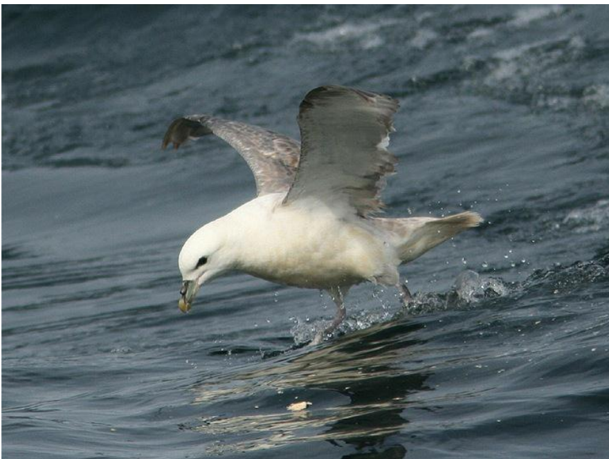
Noordse Stormvogel (Ricardo van Dijk)

We varen vanuit Lauwersoog naar het midden van de Noordzee, op de grens met Engelse wateren. Ons hoofddoel is de Klaverbank en de Botney Cut. De Klaverbank is een gebied met een zeer afwisselende bodemstructuur. De bank zelf bestaat uit relatief ondiepe delen, maar wordt doorkruist door één diepe geul: de Botney Cut. De Botney Cut is één van de diepste delen van de Nederlandse Noordzee. Deze afwisseling van diepe en ondiepe delen maakt het gebied waarschijnlijk erg voedselrijk en daarom een uiterst interessante plek voor zeevogels en zeezoogdieren.